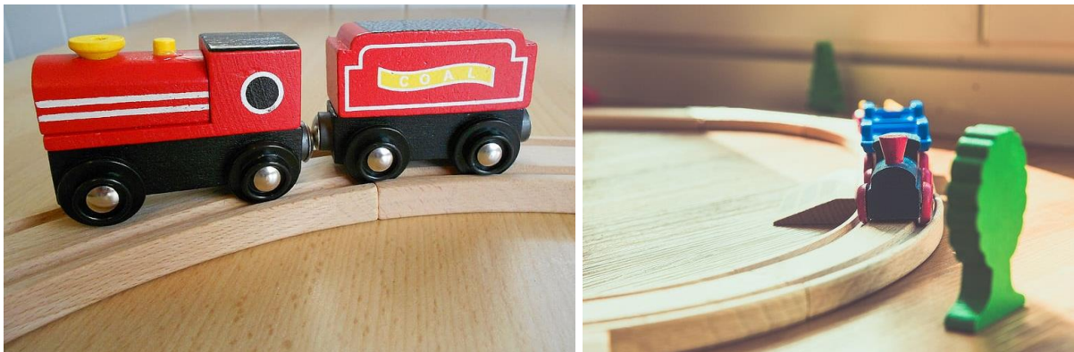
Afbeelding: Voorbeeld van een willekeurige houten speelgoed treinset die niet per definitie door de NVWA is beoordeeld.

In 2020 bemonsterde de NVWA 21 verschillende sets in de categorie houten speelgoedtreintjes. De sets zijn geselecteerd op basis van zoveel mogelijk verschillende merken en importeurs. Hierdoor is een representatief beeld van de markt ontstaan.