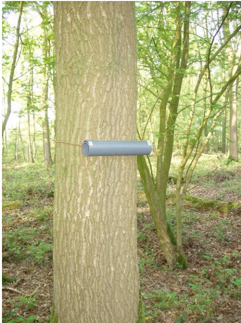
Figuur 2. Geplaatste haarval bij Weert.

Alle haren zijn op habitus gedetermineerd. De verschillen tussen beide soorten zijn voldoende groot om op deze wijze te kunnen determineren (rode tinten bij de rode eekhoorn en scherpe contrasten bij de overgang van de banderingen bij de Pallas' eekhoorn).