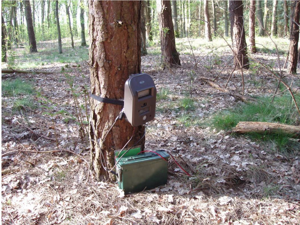
Figuur 3. Geplaatste cameraval bij Weert.

camera's gecontroleerd. Indien er eekhoorns op stonden, werden ze verplaatst. Indien er geen eekhoorns op stonden, werden ze twee weken later verplaatst.