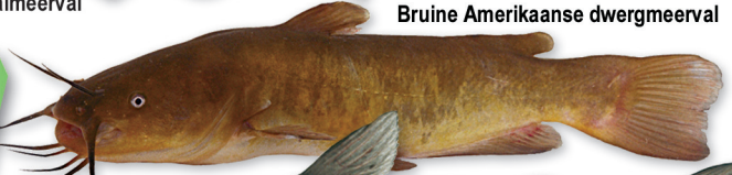
Bruine Amerikaanse dwergmeerval