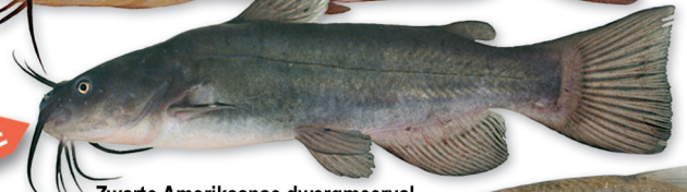
Zwarte Amerikaanse dwergmeerval