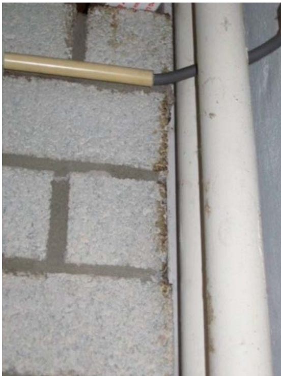
Buiksmeer op de rand van een muur

Vettige (donkerkleurige) afscheiding van de (vette) buikharen van de muis. De afscheiding blijft achter op plekken waar muizen veel lopen. Bijvoorbeeld op muren waar de muis vaak tegenaan klimt.