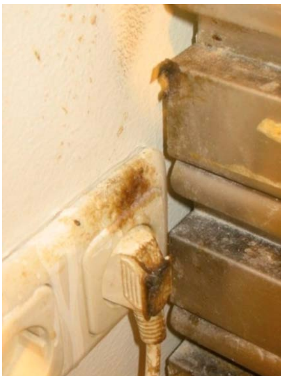
Buiksmeer op stekker