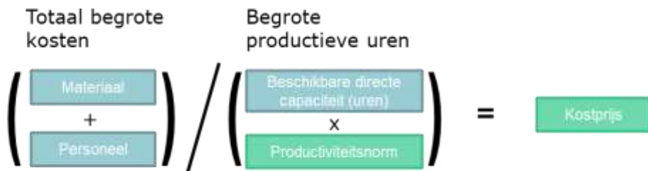
Tabel 2. Kostprijzen voorcalculatie 2021

Ieder jaar worden de ontwikkelingen van loon- en prijsbijstellingen en de ontwikkeling van het aantal productieve uren in de kostprijzen verwerkt. Deze kostprijzen worden gebruikt voor de afrekening met de Ministeries van LNV en VWS. De kostprijs wordt bepaald door per product de totale begrote kosten te delen door de begrote productieve uren. Het in tabel 1 opgenomen bedrag in de kolom Subtotaal zijn de totale kosten die in de kostprijzen zijn opgenomen. De kosten in de kolom EGB's worden buiten de kostprijzen gehouden.