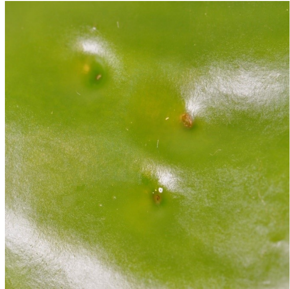
Close-up van littekens veroorzaakt door voeding/ei-afzet door de adult van Anthonomus eugenii © NVWA.