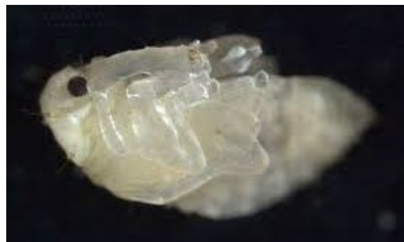
Pop van Anthonomus eugenii gezien vanaf de zijkant.