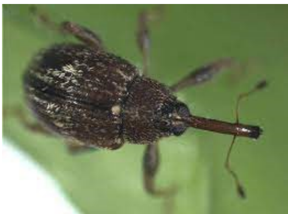
Adult van Anthonomus eugenii .