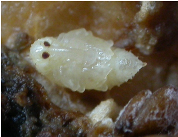
Pop van Anthonomus eugenii gezien vanaf buikzijde. © NVWA.