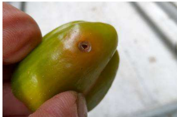
Gaatje waar een adult van Anthonomus eugenii uit de vrucht is gekropen © NVWA.