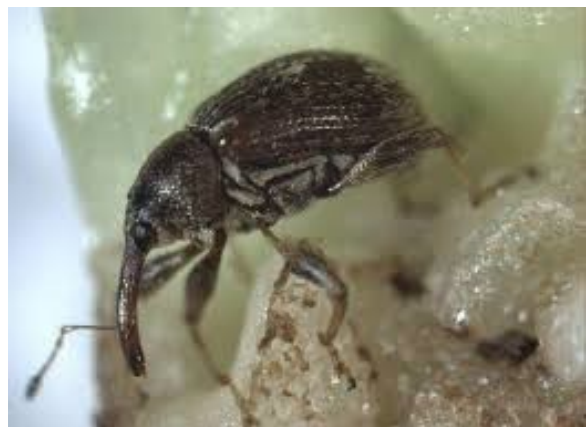
Adult van Anthonomus eugenii .