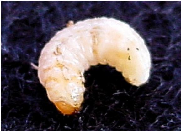
Larve van Anthonomus eugenii . Linksonder het bruine kopje.