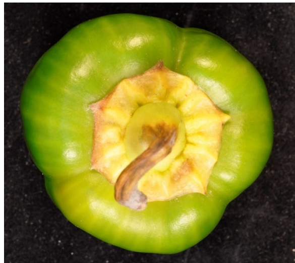
Verdroging van kroon en vruchtsteel als gevolg van aantasting door Anthonomus eugenii .