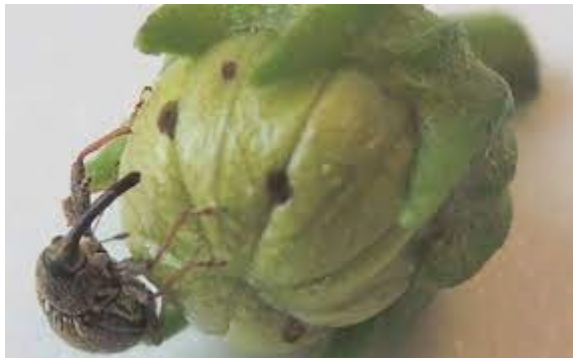
Gaatjes in knop van paprikabloem door kever van Anthonomus eugenii