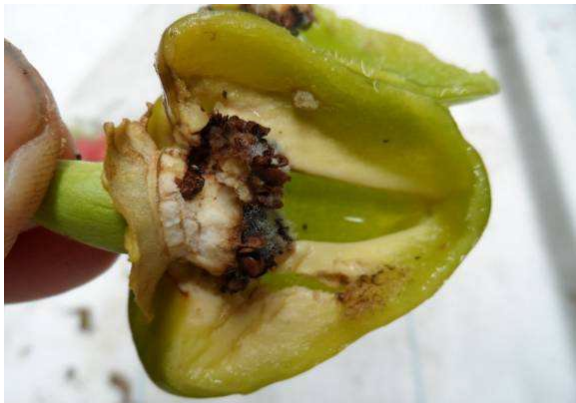
Aangevreten zaadlijsten door Anthonomus eugenii in jonge paprikavruucht.