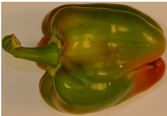
Ongelijkmatige kleuring als gevolg van aantasting door Anthonomus eugenii .