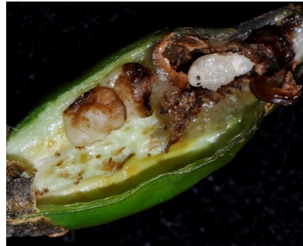
Aangevreten zaden en pop (rechtsboven) van Anthonomus eugenii in Capsicumvrucht.