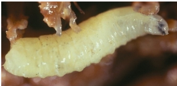
Larve van een boorvlieg.

Ook vliegenlarven, waaronder boorvliegen, tasten vruchten aan. Ze geven deels dezelfde symptomen zoals inboor- of uitboorgaatjes, ongelijkmatige verkleuring en rotte plekken. De larve van de meeste van deze soorten is een typisch made: zonder (duidelijke) kop en pootjes. Ze zijn niet gekromd en hebben geen (donker) kopkapsel. Overigens heeft een groot deel van de boorvliegen op vruchten / vruchtgroenten de EU-quarantainestatus. Wees daarom alert bij een ongewone aantasting in vruchten / vruchtgroenten door grotere maden (circa 1 cm lang).