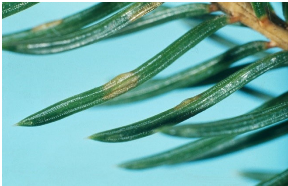
Donkerverkleuring in naald op plek waar eitje van Gilpinia hercyniae is gelegd.