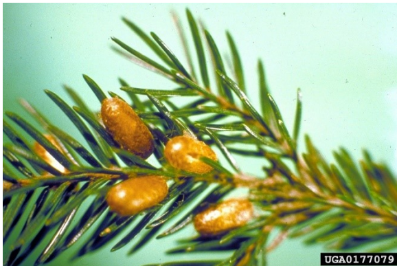
Pop-cocons van de zomergeneratie van Gilpinia hercyniae .