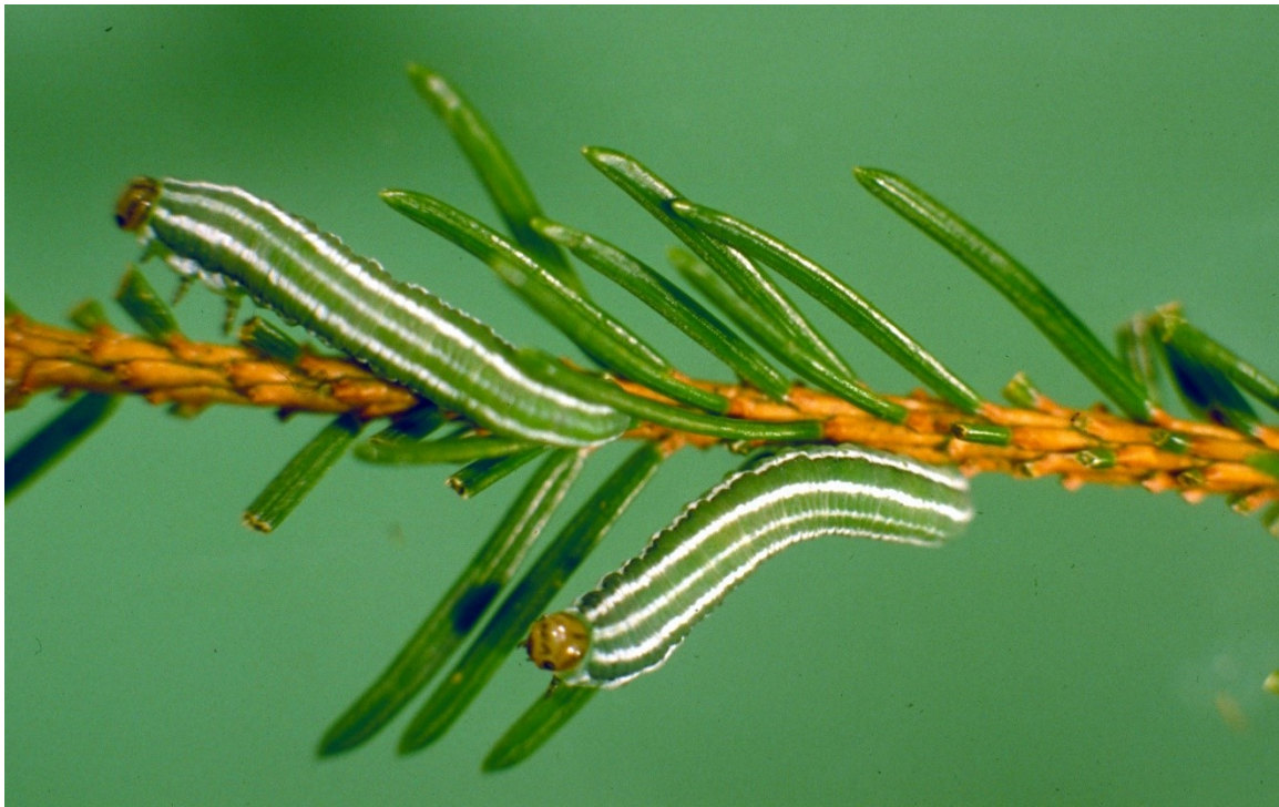
Vraat aan de naalden door larven van Gilpinia hercyniae .