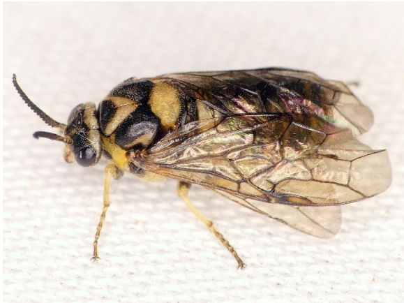
Adult van Gilpinia hercyniae .