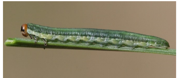
Volgroeide larve van Gilpinia hercyniae .