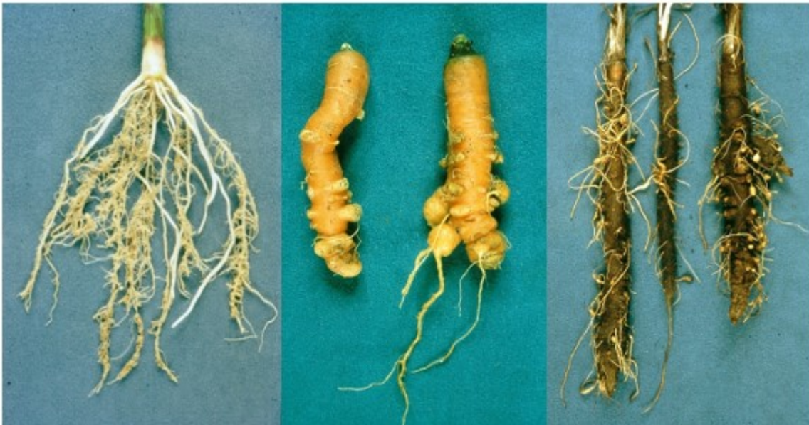
Knobbels op wortels van respectievelijk maïs, peen en schorseneer.

Knobbels op de wortels. In het algemeen blijven deze knobbels klein tot zeer klein. Bij knol- en wortelgewassen ontstaan ook knobbels op penwortels en verdikkingen en ruwschilligheid op de knollen. Bij aansnijden van aardappelknollen zijn glazige tot bruine vlekjes te zien. Er is geen verschil te zien tussen de symptomen van Meloidogyne chitwoodi en Meloidogyne fallax . Een verminderde groei van planten kan duiden op aantasting van de wortels door deze aaltjes.