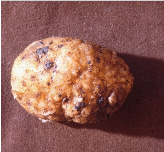
Een aardappelknol met verdikkingen en een ruwe schil