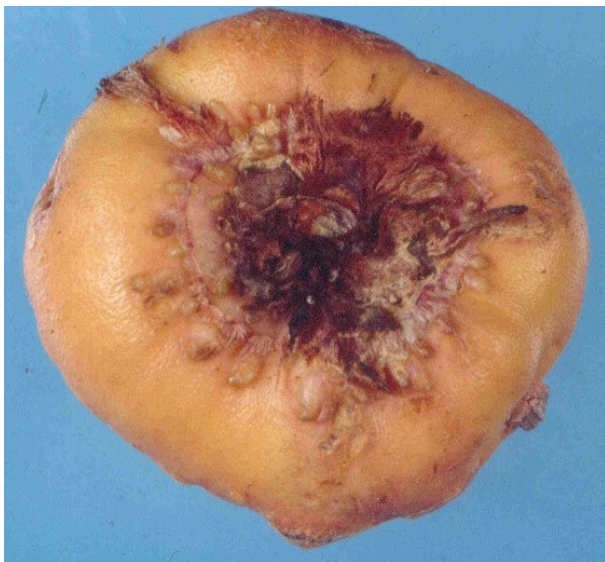
Verdikkingen/knobbels op de knol van gladiool