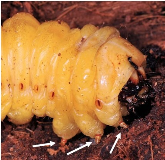
Voorzijde rups van Paysandisia archon met korte pootjes (pijlen) en rechts de kop.