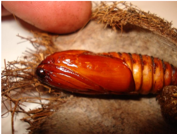
Pop van Paysandisia archon in cocon met witte, zijdeachtige binnenkant.