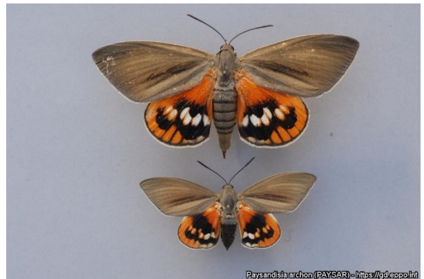
Adulten van Paysandisia archon .