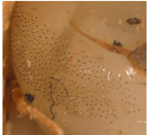
Spikkeltjes (stekeltjes) op rugzijde van rups van Paysandisia archon .