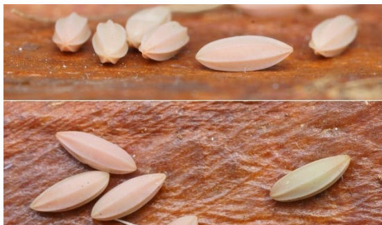
Eitjes van Paysandisia archon .