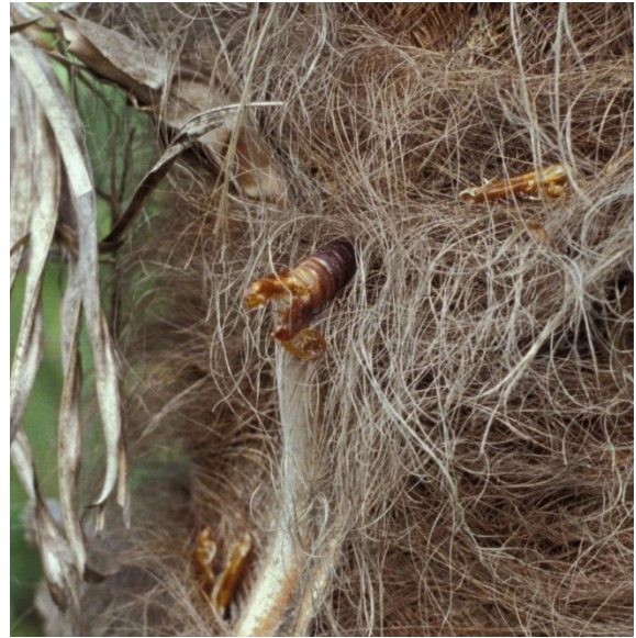
Lege pophuid die uit de stam steekt.