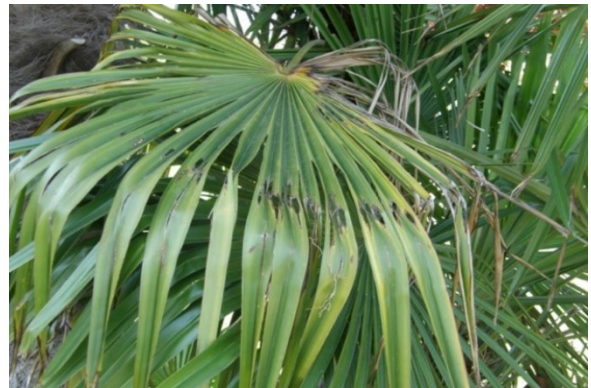
Schadebeeld aan jong blad: rij met gaten. © Giunta Regionale dell'Emilia-Romagna .