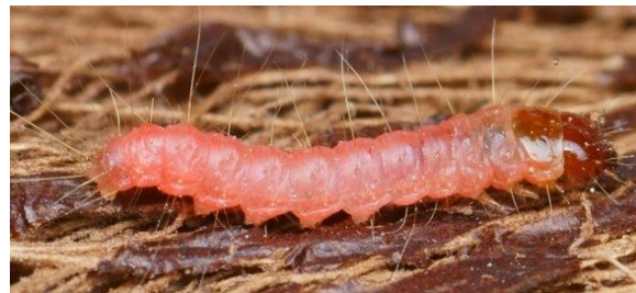
Zeer jonge rups van Paysandisia archon .