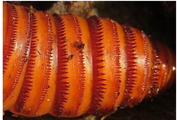
Pop van Paysandisia archon , rugzijde met rijen tandjes.