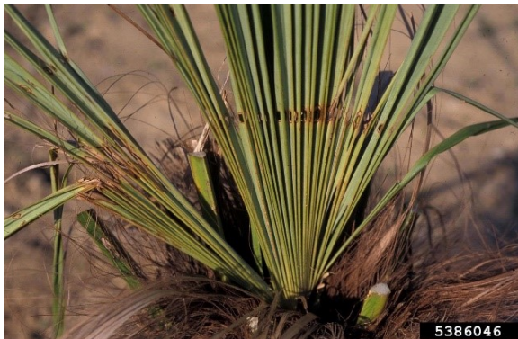
Schadebeeld aan jong blad: rij met gaten.