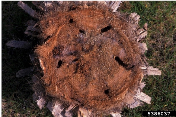
Gangen in de stam.