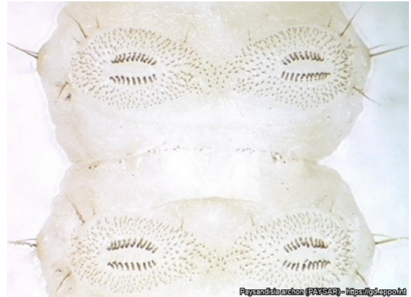
Groepjes streepjes en spikkeltjes op de buik van rups.