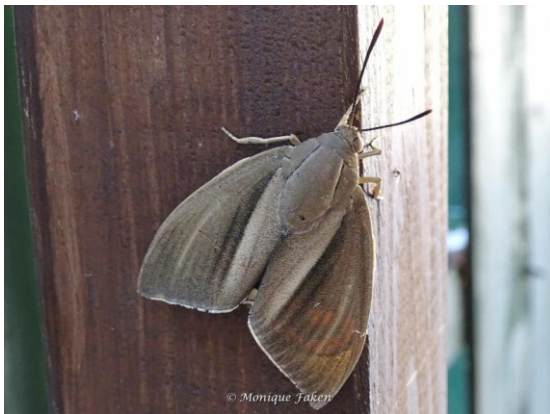
Adult Paysandisia archon .