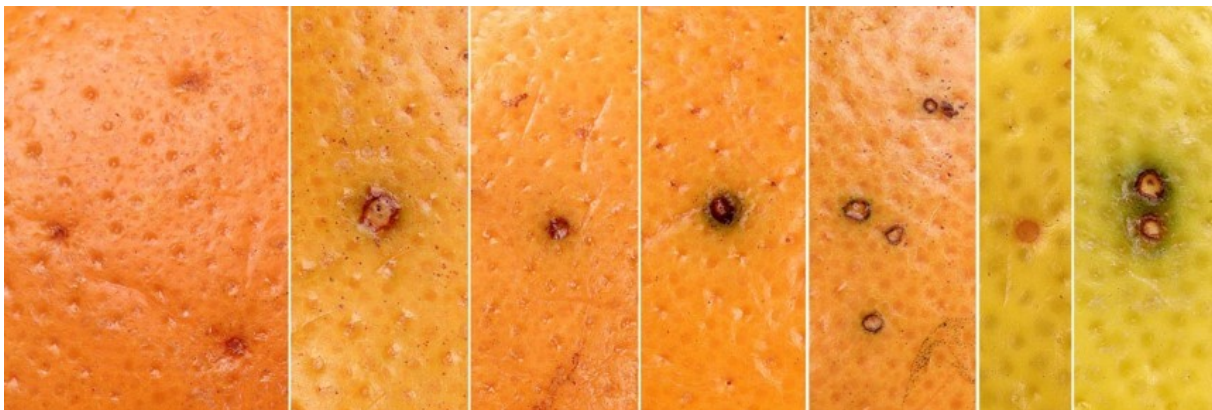
Beginnende symptomen op vrucht Citrus sinensis veroorzaakt door Phyllosticta citricarpa .