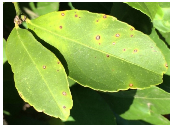
Bladvlekken op blad van Citrus limon .