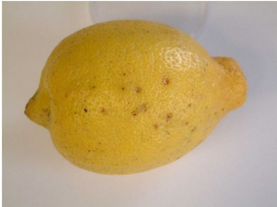
Symptoom op vrucht Citrus limon veroorzaakt door Phyllosticta citricarpa .