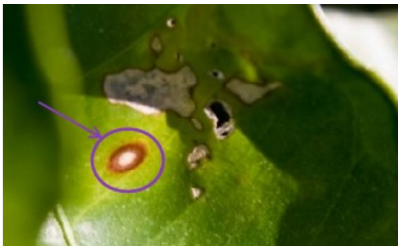
Oudere bladvlek op Citrus "valencia" veroorzaakt door Phyllosticta citricarpa .