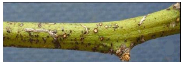
Bladvlekken op tak van Citrus limon veroorzaakt door Phyllosticta citricarpa .