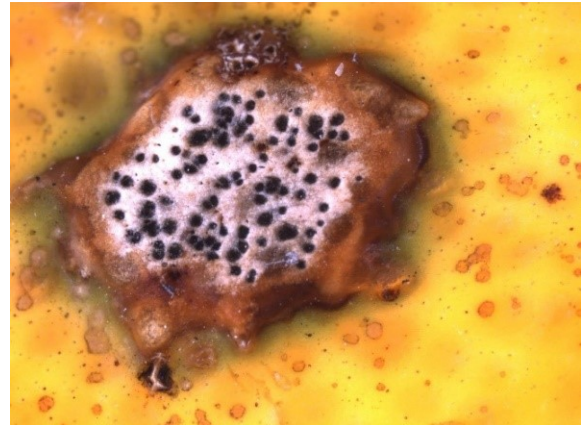
Aangetaste plek met de voor Phyllosticta citricarpa kenmerkende zwarte stipjes op Citrus reticulata .