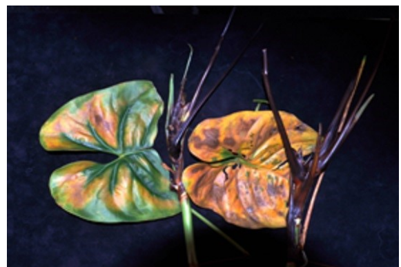
Symptoom van Ralstonia op Anthurium.

In de aardappelknol is na doorsnijden een bruinverkleuring van de vaatbundelring zichtbaar. Onder vochtige omstandigheden kunnen daarop na enige tijd crèmewitte slijmdruppels ontstaan.