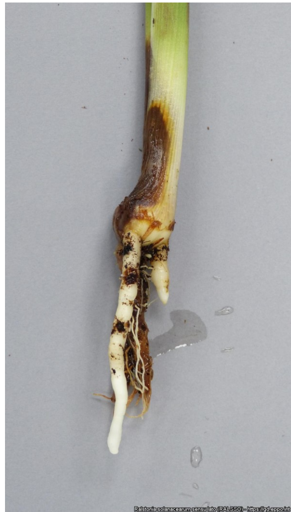
Bruine plekken op stengelbasis en wortel bij Cucurma-plant door Ralstonia .