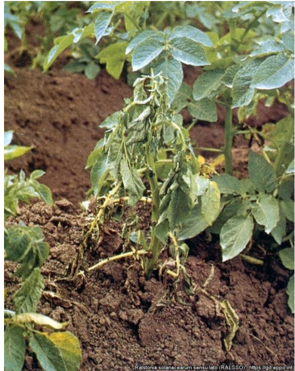
Verwelking bij aardappel door Ralstonia .