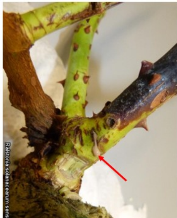
Bruinverkleuring van stengel met daaronder slijm (pijl) bij Rosa door Ralstonia .