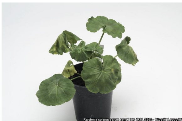
Verwelking bij Pelargonium door Ralstonia .