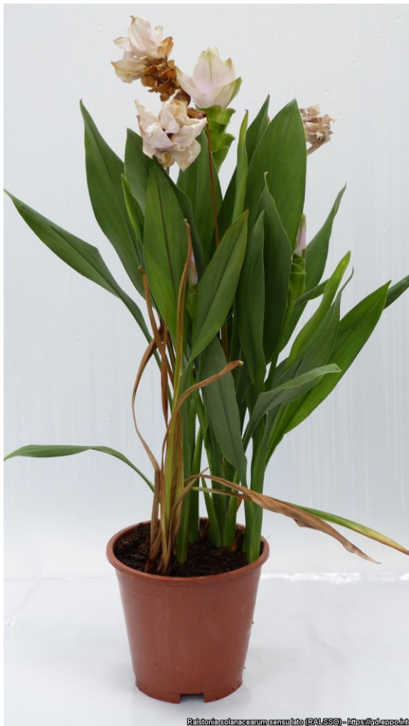
Verwelking bij Cucurma-plant door Ralstonia .