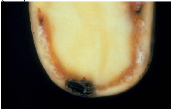
Bruine ring in knol van aardappel met crème-witte slijmdruppels door Ralstonia .