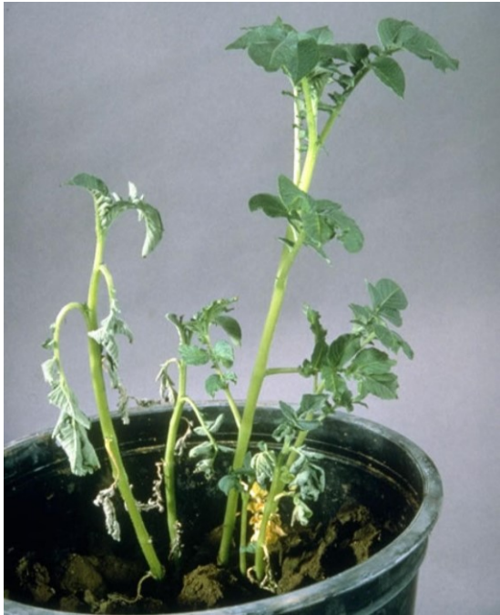
Verwelking bij aardappel door Ralstonia .