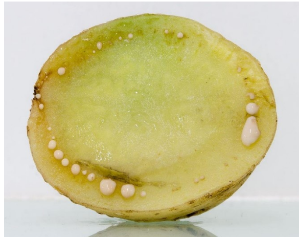
Vage bruine ring en slijmdruppels door Ralstonia in knol van aardappel.