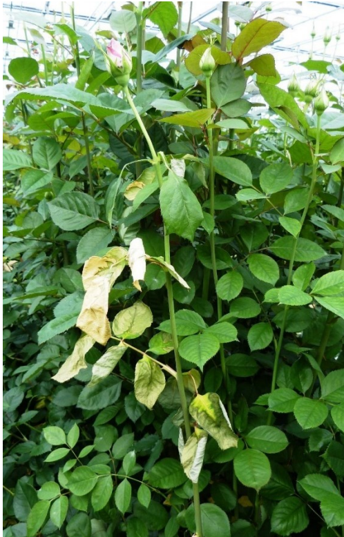
Verwelking bij Rosa door Ralstonia .

Symptomen komen voor beiden soorten bacteriën overeen. Verwelking van (delen van) de plant kan wijzen op infectie met Ralstonia . Ook veel andere ziektes veroorzaken verwelking. Een gevorderde infectie met Ralstonia veroorzaakt ook crème/bruin verkleurde plekken op stengel en wortel waaruit bij beschadiging soms crèmewit (bacterie)slijm komt. Voor meer details van de symptomen bij aardappel zie het NVWA webdossier bruinrot .