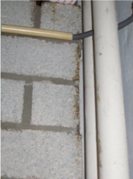
Buiksmeer op de rand van een muur

Vettige (donkerkleurige) afscheiding van de (vette) buikharen van de muis. De afscheiding blijft achter op plekken waar muizen veel lopen. Bijvoorbeeld op muren waar de muis vaak tegenaan klimt.