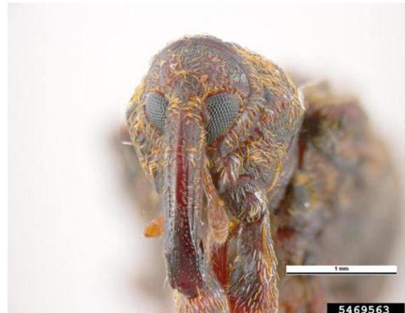
Voorzijde kop van Conotrachelus nenuphar met lange snuit en oranje haren.