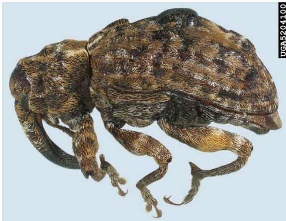
Kever van Conotrachelus nenuphar , met op de rug een zwarte 'wrat'.