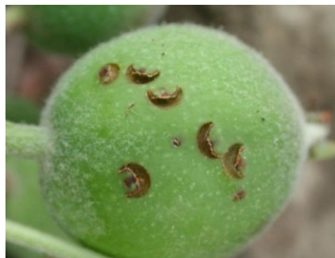
Sikkelvormige beschadiging door Conotrachelus nenuphar op appel.