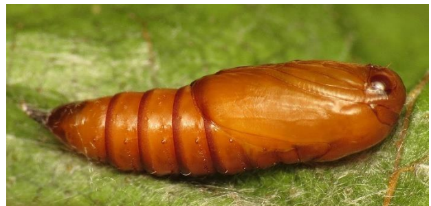
Pop van een bladroller (mot): vleugels, antennen en poten zijn vergroeid met het lijf.