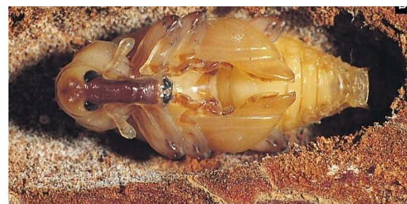
Typische, gekromde, larve (boven) en pop van een snuitkever.