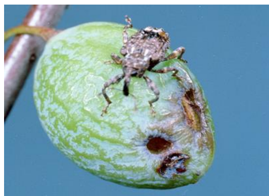
Pruim met sikkelvormige beschadiging en uitgangsgat van Conotrachelus nenuphar .