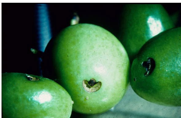
Symptoom Conotrachelus nenuphar op pruim.

Bij aantasting door vruchtborende rupsen zoals de fruitmot ( Cydia pomonella ) komt er vaak (veel) frass uit het inboorgat. Bij Conotrachelus nenuphar niet of nauwelijks.