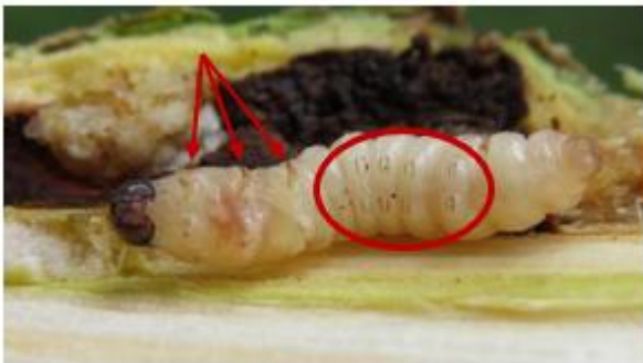
Rups van een wesplinder met 3 paar korte pootjes (pijltjes) en 8 kransjes van donkere streepjes op de buikzijde (omcirkeld).

Door de bultjes midden op dekschilden is de kever van Conotrachelus nenuphar niet te verwarren met Europese snuitkevers. De larven en poppen zijn echter alleen door een expert te onderscheiden van die van andere vrucht borende kevers. De larven lijken ook op (vrucht borende) rupsen. Rupsen hebben echter 3 paar korte pootjes en 8 groepen streepjes (haakjes) aan de onderkant van de buikpoten; larven van snuitkevers hebben dit niet. De poppen zijn te onderscheiden van vlinderpoppen doordat bij kevers de poten, antennen en vleugels los aangehecht zijn aan lijf; bij vlinderpoppen zijn deze vergroeid met het lijf.