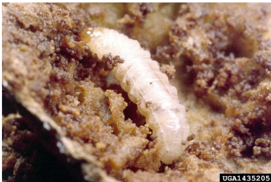
Larve van Conotrachelus nenuphar .