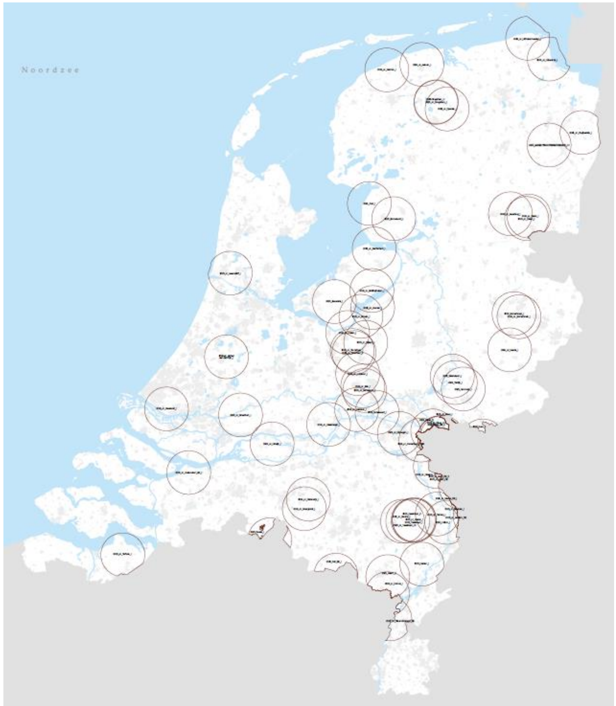
Kaart met de in totaal 76 beperkingsgebieden ten gevolge van HPAI-uitbraken.

Bijlage 3: Overzicht met daarin de in totaal 76 ingestelde beperkingsgebieden met daarbij de begin- en einddata. Het gaat om beperkingsgebieden ten gevolge van HPAI-uitbraken sinds januari 2025 t/m juni 2026 bij 9 kleinschalige houderijen, 48 pluimveebedrijven en 19 HPAI-uitbraken in het buitenland.